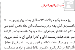
کامران کارشناس، رئیس هیات مدیره اتاق بازرگانی اصفهان